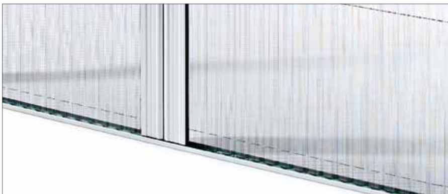
Die optional erhältliche, niedrige Bodenführungschiene reduziert die Stolpergefahr wesentlich.