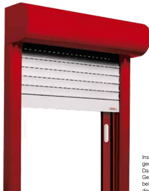
Insektenschutz-Plissee geöffnet: Das in Falten gelegte Gewebe reduziert sich beim Öffnen auf ca. 2% der Gesamtbreite.